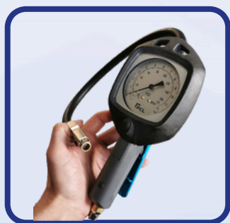
Pistolet de gonflage premium