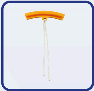
Protecteur de rebord de jante