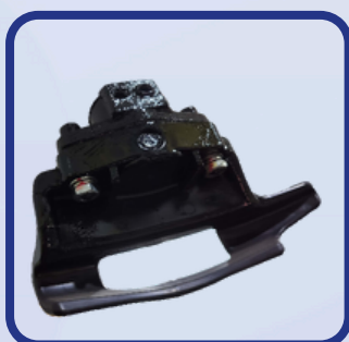
Tête de montage en résine