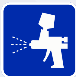
Peinture thermo laquée