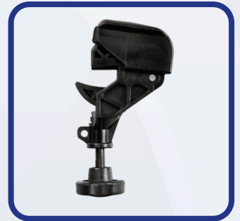
Maintien du talon (pince)