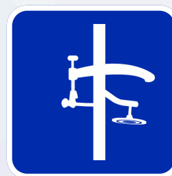
Bras d'assistance en option