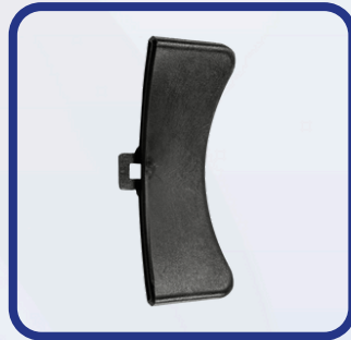
Protection du détalonneur