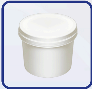
Pot à graisse