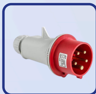
Prise d'alimentation 380 V