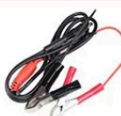
câble d'alimentation à double pince