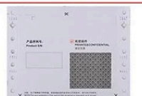
Enveloppe universelle de mot de passe