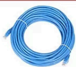
câble réseau gigabit (15m)