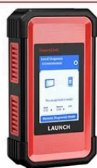
HD BOX 2.0